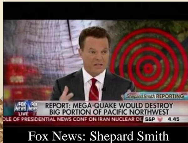
Fox News: Shepard Smith